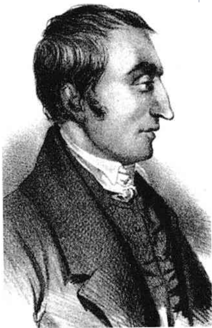
Henri de Saint-Simon.

ar fi inevitabilă și Franța ar deveni o națiune de rang secund. 4